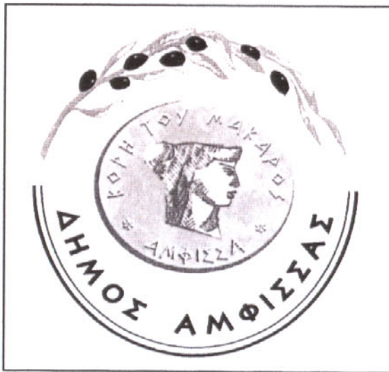
Εικόνα 2.2: Δήμος Άμφισσας

Άγγλοι περιηγητές 8 στις αρχές του 1800 γράφουν ότι <<εις την διοίκηση των Σαλώνων υπήγοντο 32 κωμοπόλεις και χωριά, ότι είχε πληθυσμόν 13 χιλιάδων κατοίκων και 800 οικίας, εξων αι πεντακόσσιαι Χριστιανικά. Τα κυριότερα προϊόντα των Σαλώνων τότε ήσαν ελαιαί, έλαιον, δέρματα, μαλλιά, κρασί και βαμβάκι, το οποίον ήτο εκλεκτής ποιότητος>>.