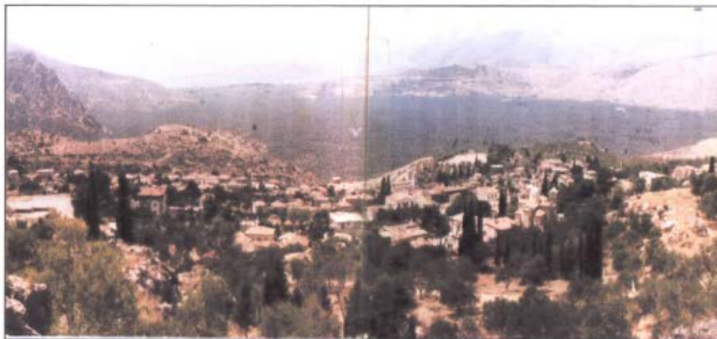
Εικόνα 2.7: Το Χρισσό με το Κρυσταίκο πεδίο.