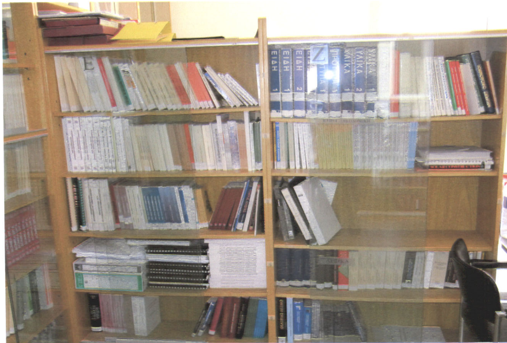
Εικόνα 9: Στήλες Ε, Ζ με θεματικό πεδίο: Έργα Πολιτικού Μηχανικού, Έργα Τοπογράφου, Κτίρια Οικοδομική – Λεξικά.