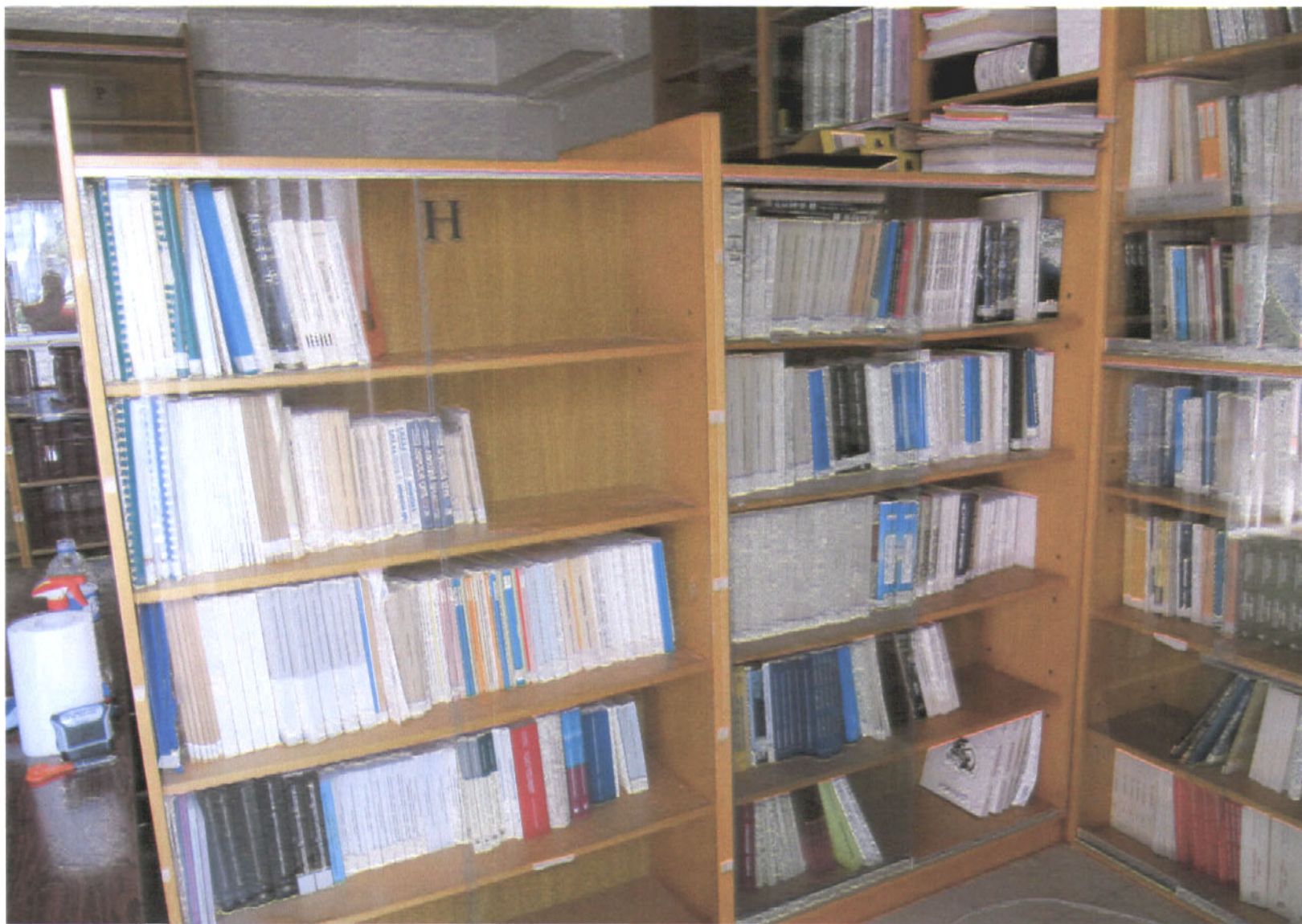
Εικόνα 7: Οι στήλες Η, Θ με θεματικό πεδίο: Μεταλλουργία – Μεταλλευτική, Ναυπηγική, Επαγγελματικά Θέματα, Μηχανολογία – Ηλεκτρολογία.