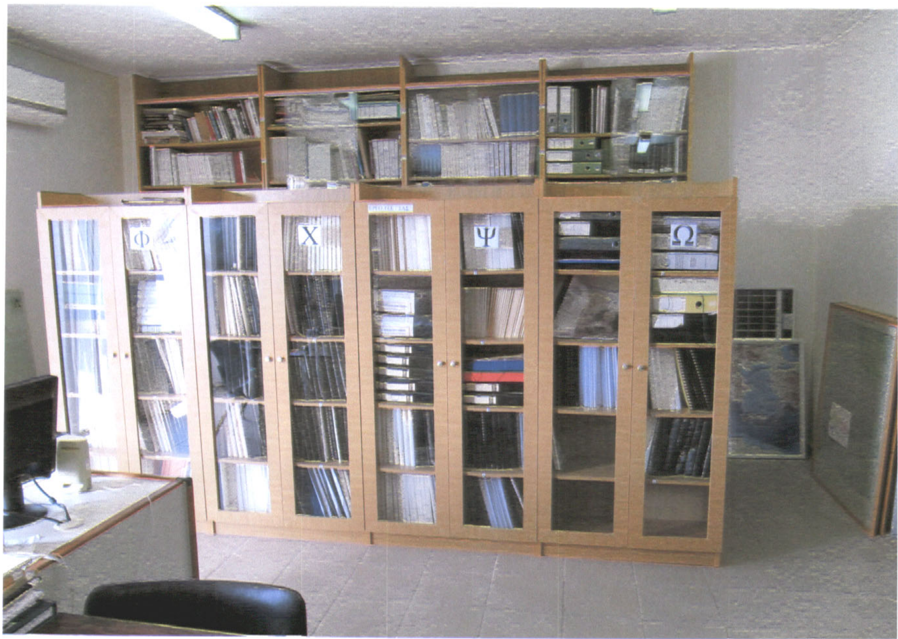
Εικόνα 4: Οι στήλες Φ, Χ, Ψ, Ω με περιεχόμενο τις Ομάδες Εργασίας.