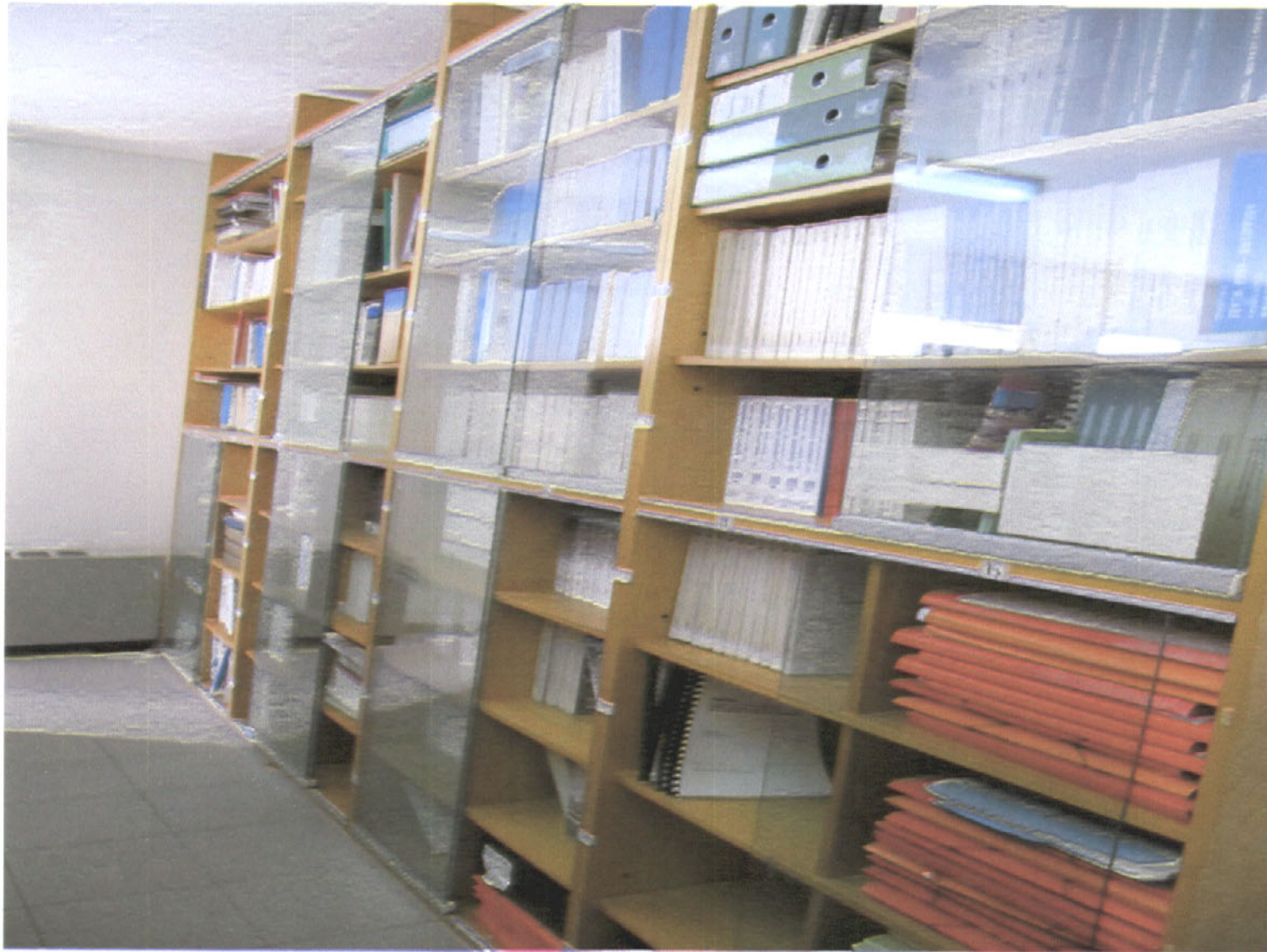
Εικόνα 5: Οι στήλες Μ, Λ, Π, Γ, Υ με θεματικό πεδίο: Χημική –Μηχανική, Χωροταξία – Πολεοδομία, Τέχνη – Φωτογραφία, Υδραυλική –Υδραυλικά έργα, Διάφορα, Σεμινάρια -Ημερίδες.