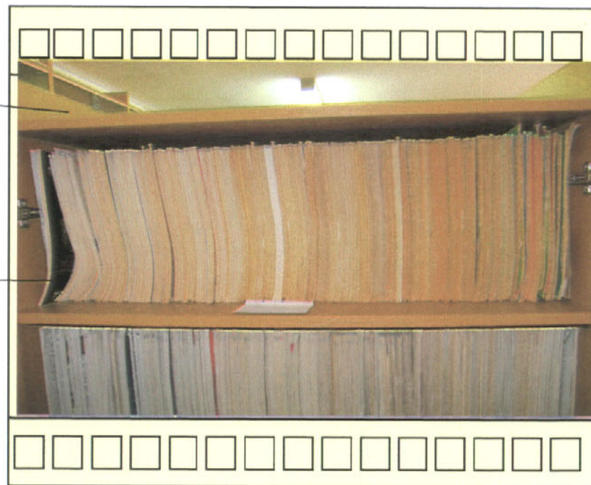
Εικόνα 3: Οι στήλες με τα Ενημερωτικά Δελτία του Τ.Ε.Ε. τοποθετημένα κατά αύξοντα αριθμό έκδοσης.