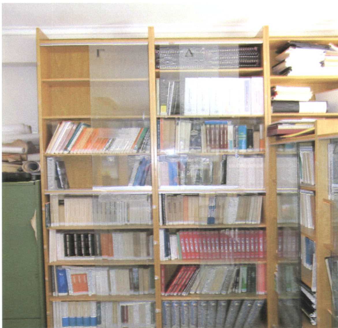
Εικόνα 8: Στήλες Γ, Δ με θεματικό πεδίο: Ενέργεια - Έργα Πολιτικού Μηχανικού.