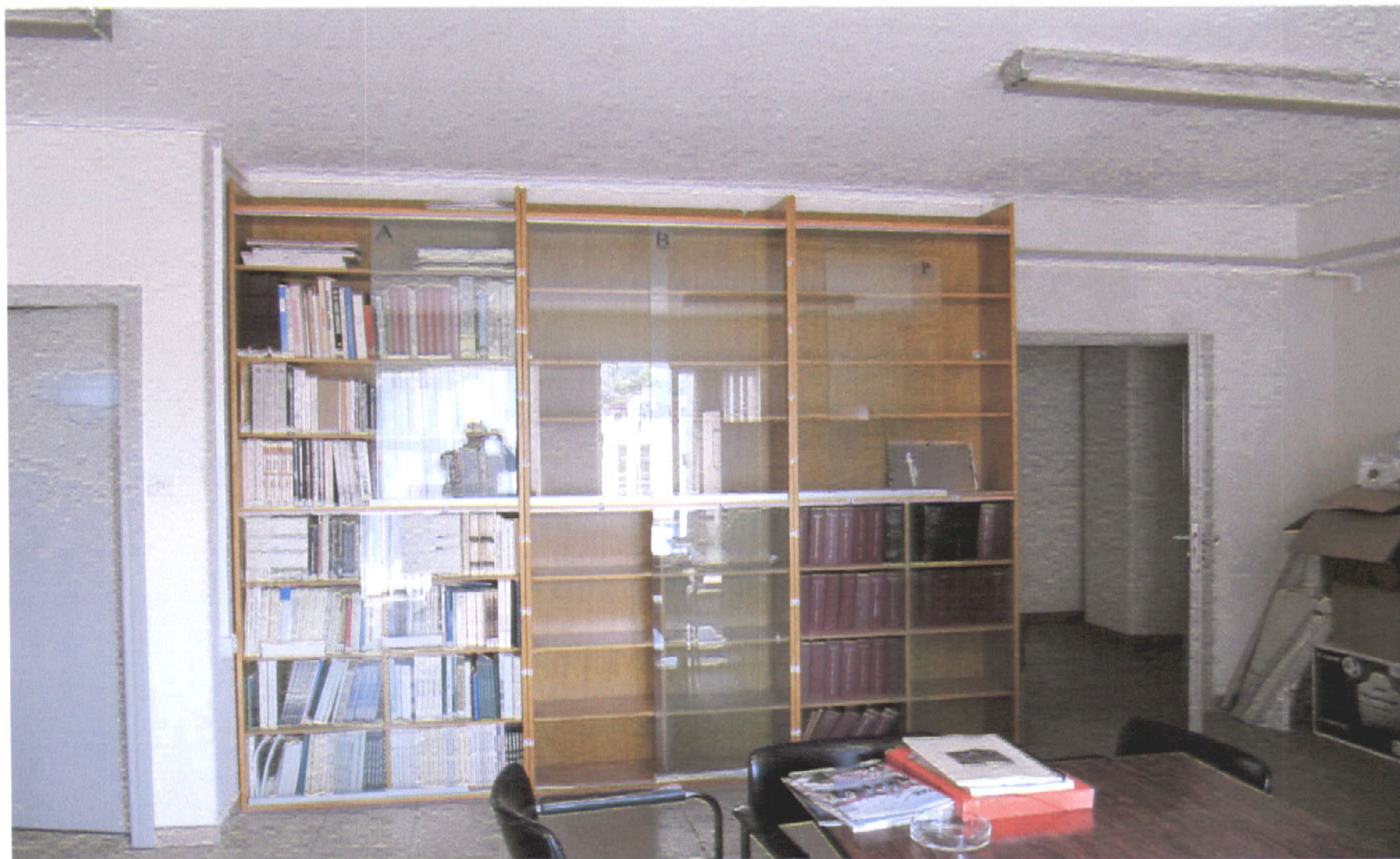
Εικόνα 10: Στήλες Α, Ρ με θεματικό πεδίο: Αρχιτεκτονική, Διαρκής Ενημερωτικός Κώδικας.