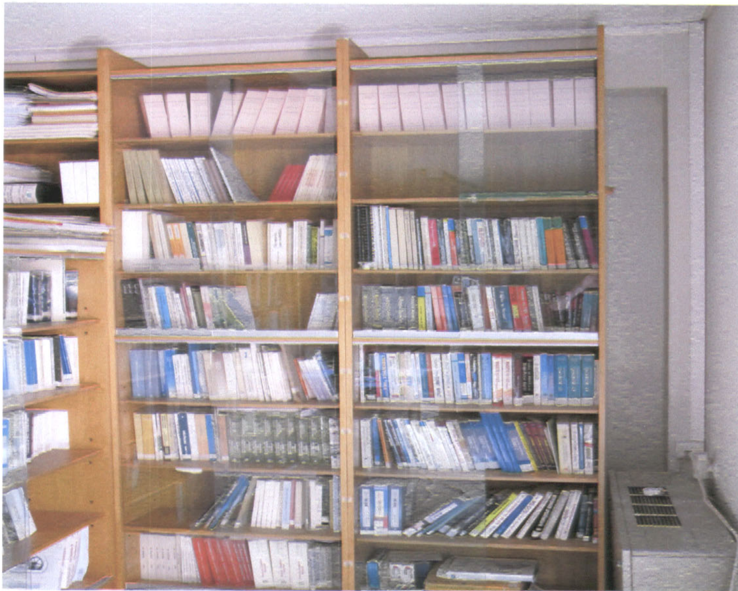
Εικόνα 6: Οι στήλες Ι,Κ με θεματικό πεδίο: Οικονομία –Πληροφορική.