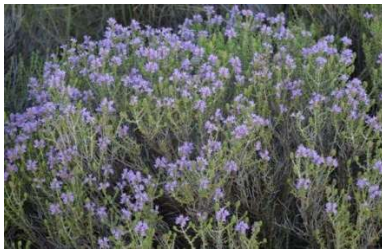
Θυμάρι ( Thymus vulgaris , T. capitatus ),