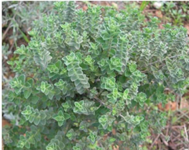
Ρίγανη ( Origanum vulgare )