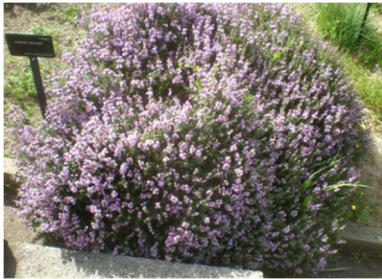
Θρούμπι ( Satureja thymbra )