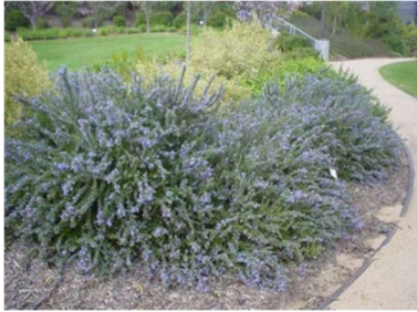
Δεντρολίβανο ( Rosmarinus officinalis )

Στη συνέχεια ο περιηγητής συναντά σε γραμμικές διατάξεις καλλιέργειες αρωματικών και καλλωπιστικών φυτών και βοτάνων, ανάμεσα του αχινόποταμου και του αμφιθεάτρου. Οι επισκέπτες μπορούν να περιηγηθούν και να γνωρίσουν την πλούσια βιοποικιλότητα συμβάλλοντας στη προστασία και διατήρηση της.